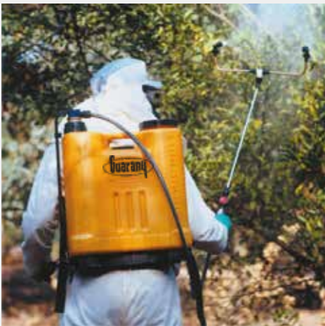
Barra universal - cód. 9798