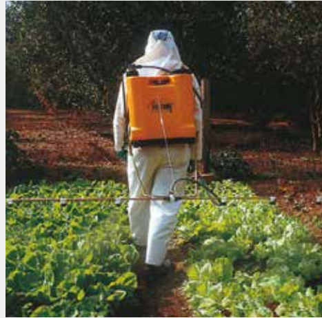
Barra horizontal trasera - cód. 9888